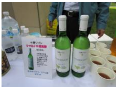
十勝ワイン限定「シャルドネ」