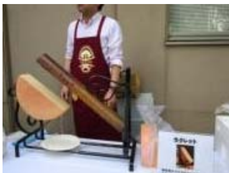
ラクレットオープン (NEEDS)