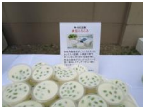
枝豆ころころ(中田食品)