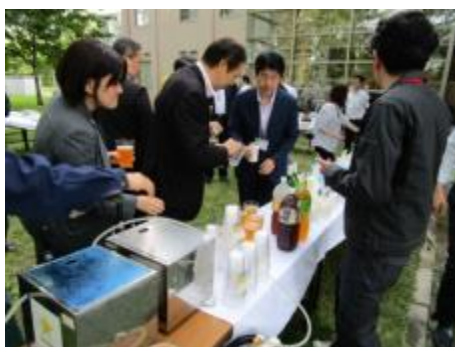
解放感溢れる野外交流会