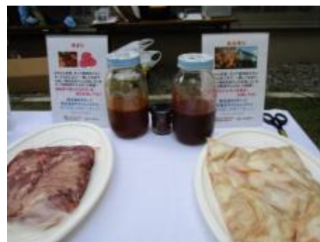
新鮮なホルモン・タン(キャトルシステム)