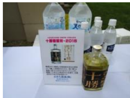
限定「十勝蒸留所 2015」 (さぼろ酒造)