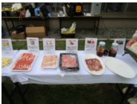
十勝ハーフ牛(ノベルズ)・豊西牛・カルビ・かみこみ豚(五日市)